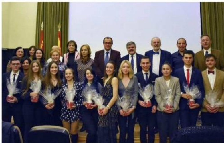
Imagen de la graduación de la quinta promoción del Bachillerato Internacional.

Las sexta y séptima promociones, actualmente escolarizadas (31