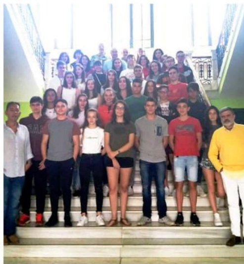
Alumnos del Bachillerato Internacional ayer en el Jorge Manrique.