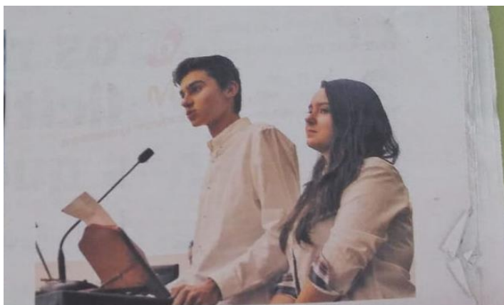
Alumnos del Bachillerato Internacional en un acto de graduación. / DP