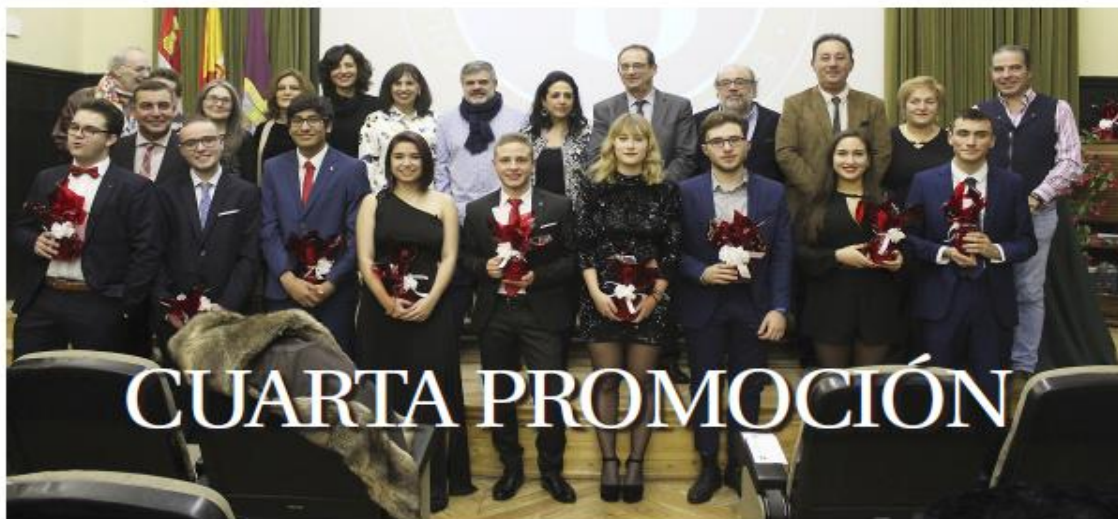
El Bachillerato Internacional del Instituto Jorge Manrique despidió redentemente a su cuarta promoción de graduados en el programa del diploma.