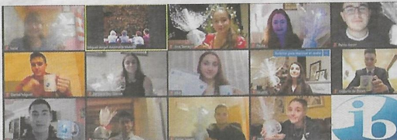
Alumnos de la sexta promoción del Bachillerato Internacional, cuya graduación tuvo lugar online el 22 de diciembre.

Señalar, por último, que el proceso de solicitud de estos estudios se inicia en enero y que existe un servicio de información permanente durante todo el año, a través del coordinador del programa.