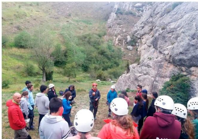
Los alumnos del Bachillerato Internacional participaron en unas jornadas de convivencia en la Montaña Palentina.