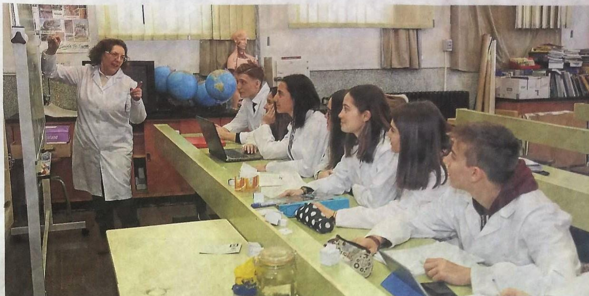
Un grupo de alumnos de primero de Bachillerato, en una clase de Biología.