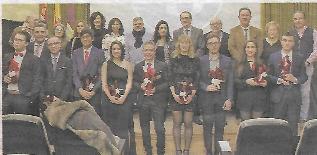
Grupo de graduados de esta disciplina educativa. ¡