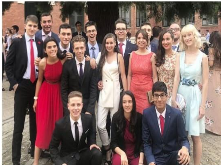
Alumnos del Bachillerato Internacional, programa que se imparte en el IES Jorge Manrique.

El Bachillerato Internacional es un proyecto altamente estimulante, que favorece la madurez intelectual, el compromiso ciudadano