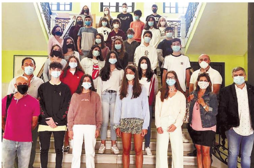
Foto de familia del alumnado del Bachillerato Internacional del Jorge Manrique.

Este curso la acogida se desarrolló en el propio Jorge Manrique y por medio de dinámicas deportivas y lúdicas se ha facilitado la presentación de los alumnos