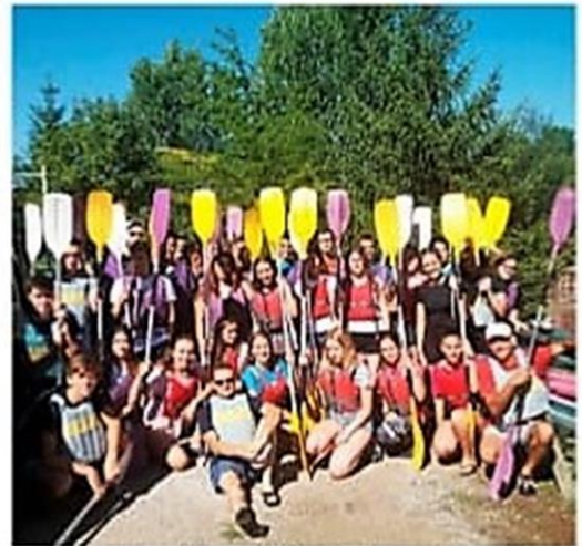
La treintena de alumnos que cursa Bachillerato Internacional desarrollaron una jornada de convivencia. Visitó la exposición de Las Edades 'Monte del Rey' y participó en actividades deportivas en Alar del Rey. 2018