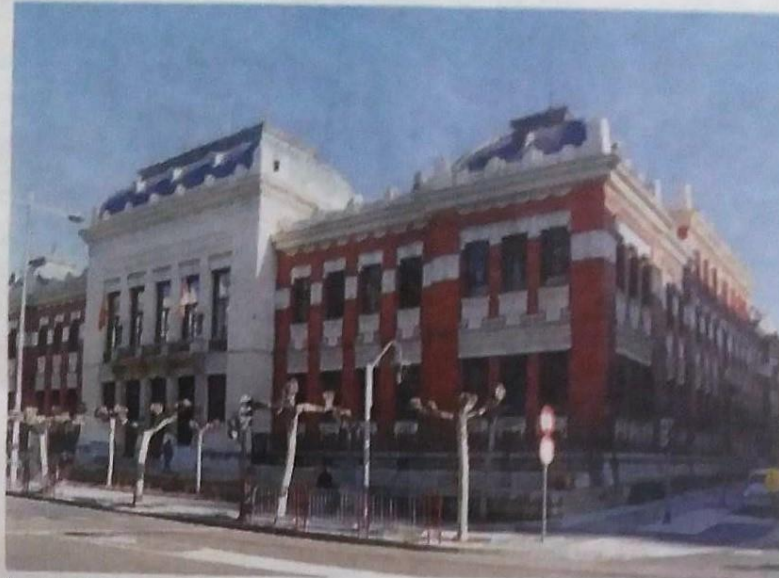
Instituto Jorge Manrique de Palencia. :: EL NORTE