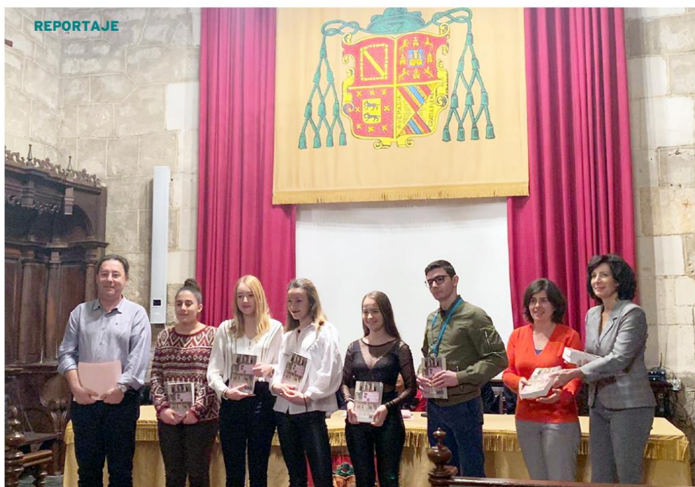
Tras dos intensos días de trabajo, en la clausura los alumnos recibieron su diploma y un ejemplar del libro en el que se publica su primera investigación.