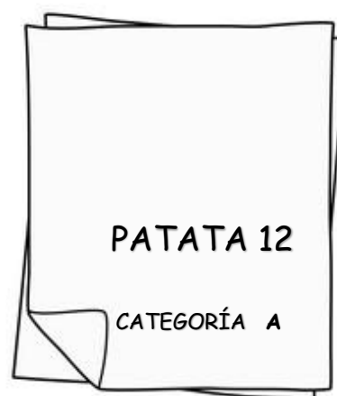
Reverso de la propuesta