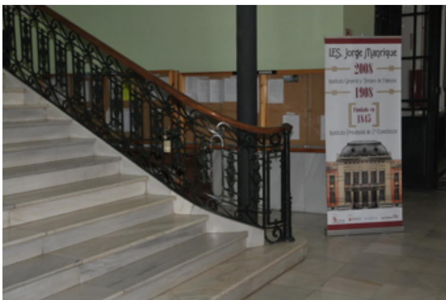
Escalera principal y cartel del I centenario de la construcción del actual edificio

El oficial de mantenimiento de 2ª distribuye su horario en dos días y turno completo de mañana y tres días en jornada partida para atender las labores necesarias para el mantenimiento del edificio y enseres.