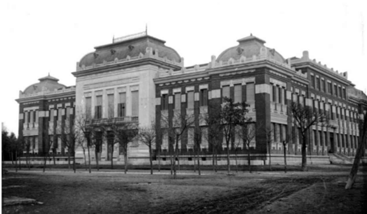
Ubicación actual del edificio del IES Jorge Manrique de Palencia

La gran remodelación de finales del siglo pasado (1991) permitió mejorar la conservación de las cubiertas, abrir una nueva biblioteca sobre el Paraninfo y debajo de la monumental cúpula de la fachada, así como ajardinar el patio interno. Su mayor logro ha sido la apertura de nuevos espacios en la tercera planta: Departamentos, Museo Jerónimo Arroyo, Aula de Medios Audiovisuales, Museo de Ciencias Naturales y Biblioteca, aparte de otras dependencias (Despacho de la AMPA, Gabinete fotográfico y Aula de Compensatoria).