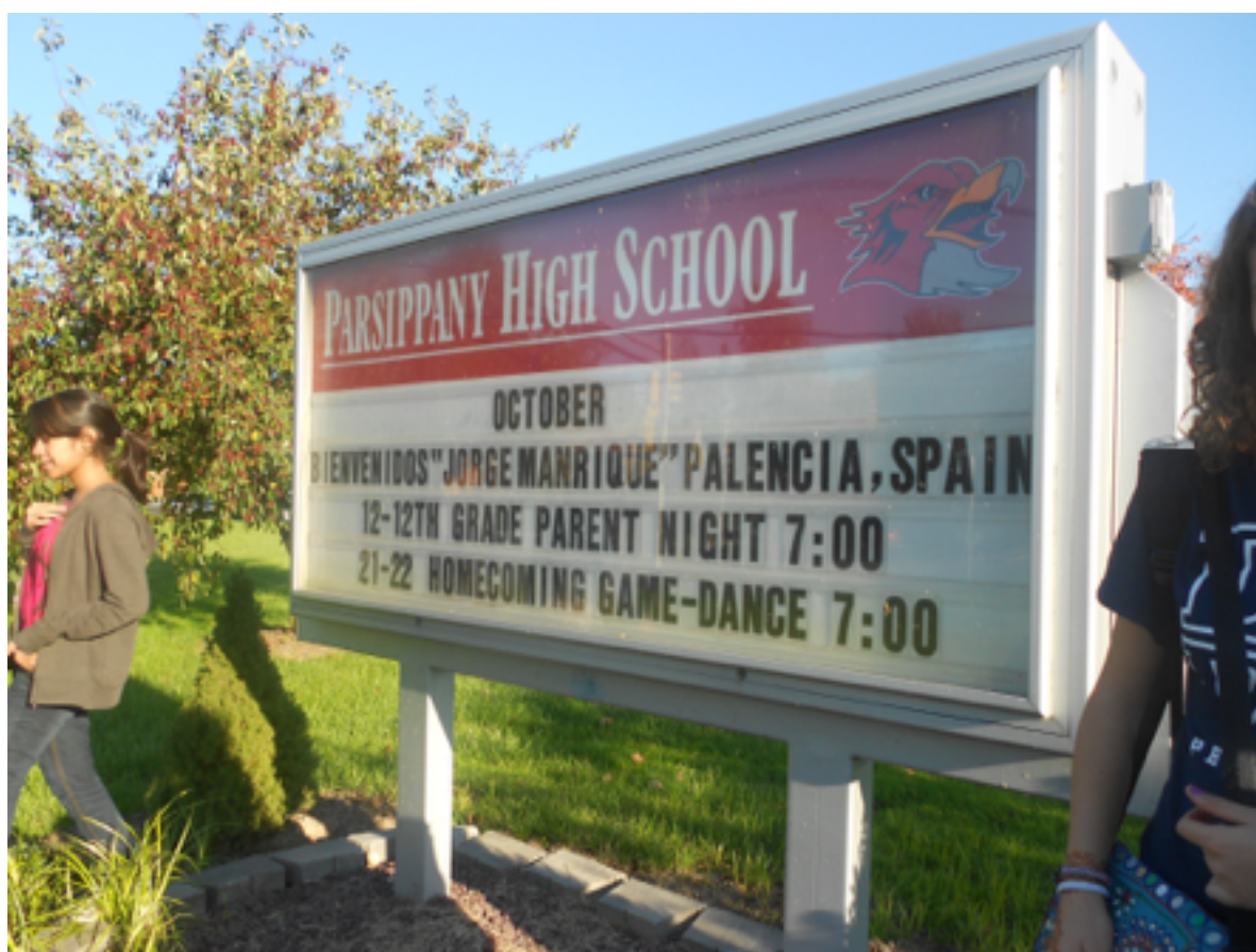
Intercambio del IES Jorge Manrique con Parsippany High School (USA)

- La búsqueda de una mejor integración entre la vida académica y la vida laboral, a través de iniciativas desarrolladas desde el propio Instituto.